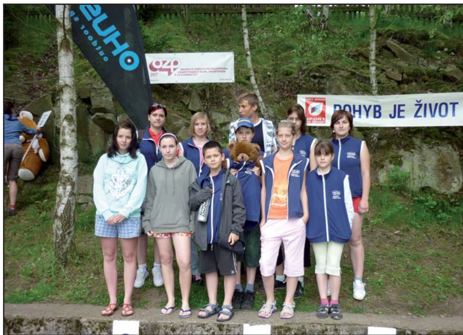
Naši zástupci na republikovém kole Medvědí stezky