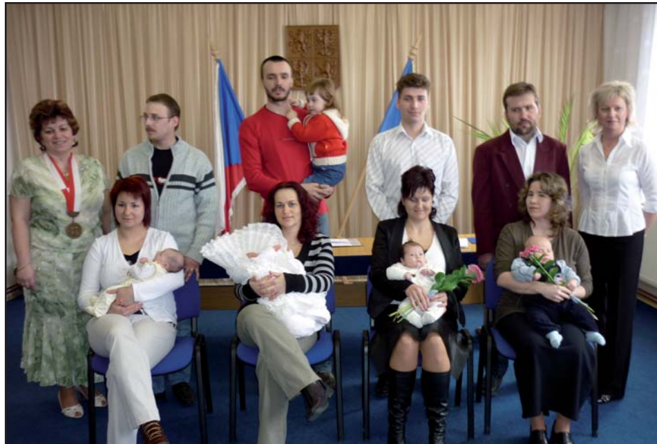
Vítání našich nových občánek