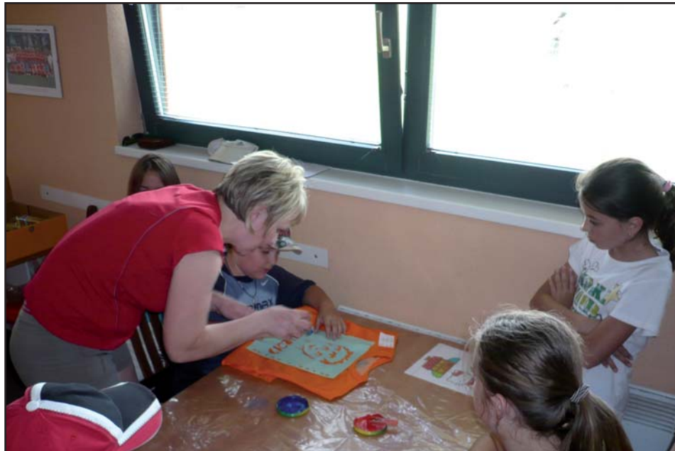
Den dětí - malování triček