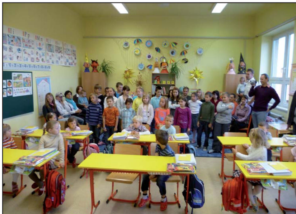
Zahájení nového školního roku v ZŠ