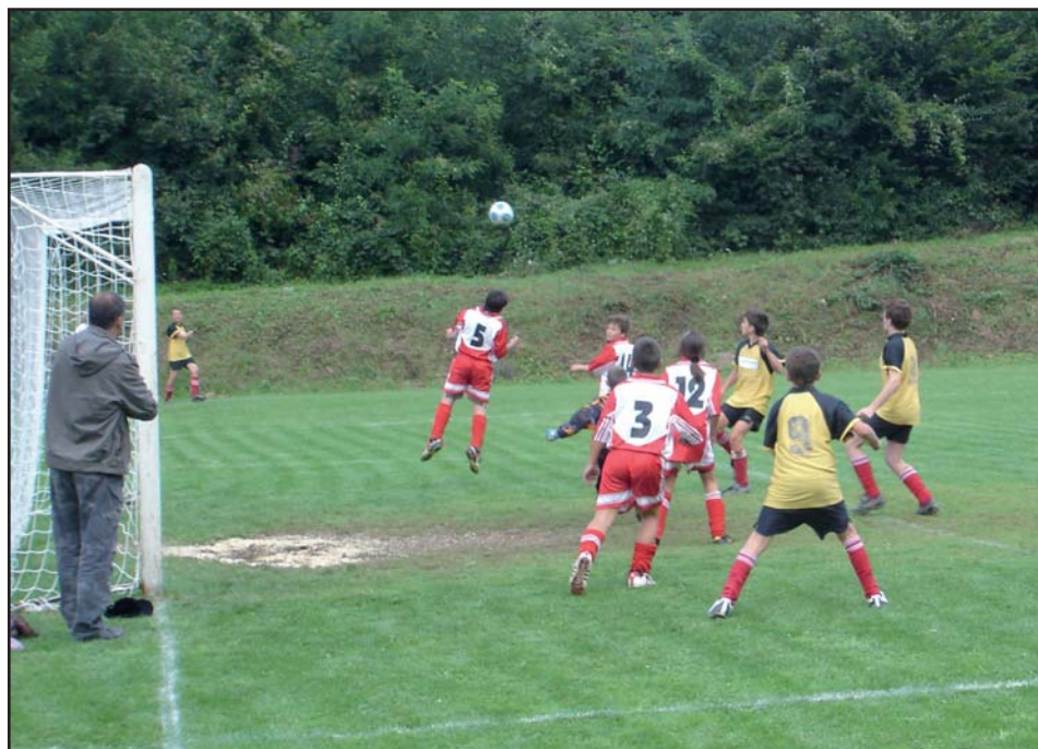
Žáci při mistrovském utkání