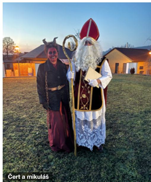
Čert a mikuláš