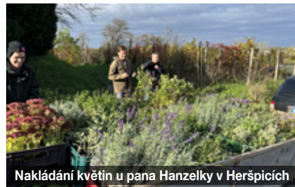
Nakládání květin u pana Hanzelky v Heršpících

Letos jsme opět nezapomněli a domluvili jsme se s obcí na projektu Rozkvetlé Rašovice. Díky dotaci od Jihomoravského kraje jsme nakoupili a v obci vysadili medonosné rostliny. V délce 360 metrů bylo vysázeno přes 1400 rostlin. Moc děkuji včelařům, kteří přišli pomoci, ale také dalším občanům Rašovic a obecním zaměstnancům. Nebylo nás málo, ale mohlo nás být víc. Vysadili jsme šalvěj, tymiány, šantu, třezalky, santolinu, len žlutý, mydlici bazalkovitou, saturejku, levandule. Věřím, že z nových květin se budeme všichni radovat na nedělních procházkách po Rašovicích.