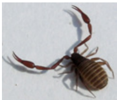
Chelifer cancroides – štírek obecný – přirozený nepřítel roztočů Varroa