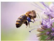
Včela na Svazence vratičolisté (oblíbená včelí pastva v létě)

Po prázdninách dne 27. září nás čekala znovu přednáška Jaroslava Bajka, tentokrát na téma Utváření pestré krajiny-výsadby pro opylovatele, polykulturní sady a agrolesnic-