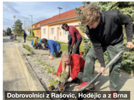
Dobrovolníci z Rašovic, Hodějic a z Brna