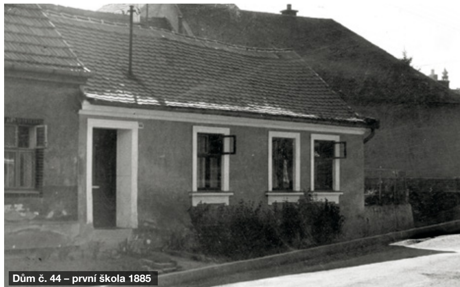
Dům č. 44 – první škola 1885