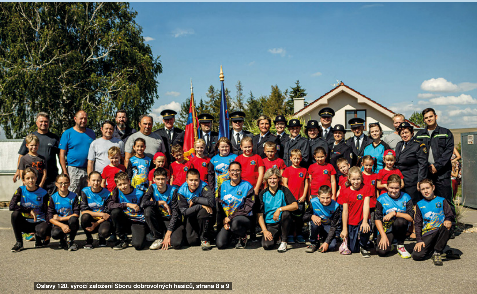
Oslavy 120. výročí založení Sboru dobrovolných hasičů, strana 8 a 9