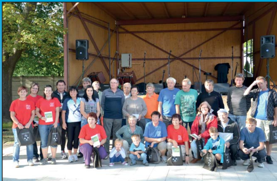
Účastníci cykloakce 2012